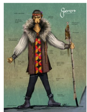
Boceto del vestuario de los protagonistas