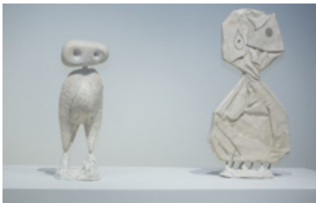
Personnage / Personaje, 1970

nera distinta en relación a su tamaño (la almendra y la piedra pueden parecer un búho, el papel de caramelo un personaje...) pero son objetos que, combinados y cambiados de tamaño, crean esculturas y obras de arte.