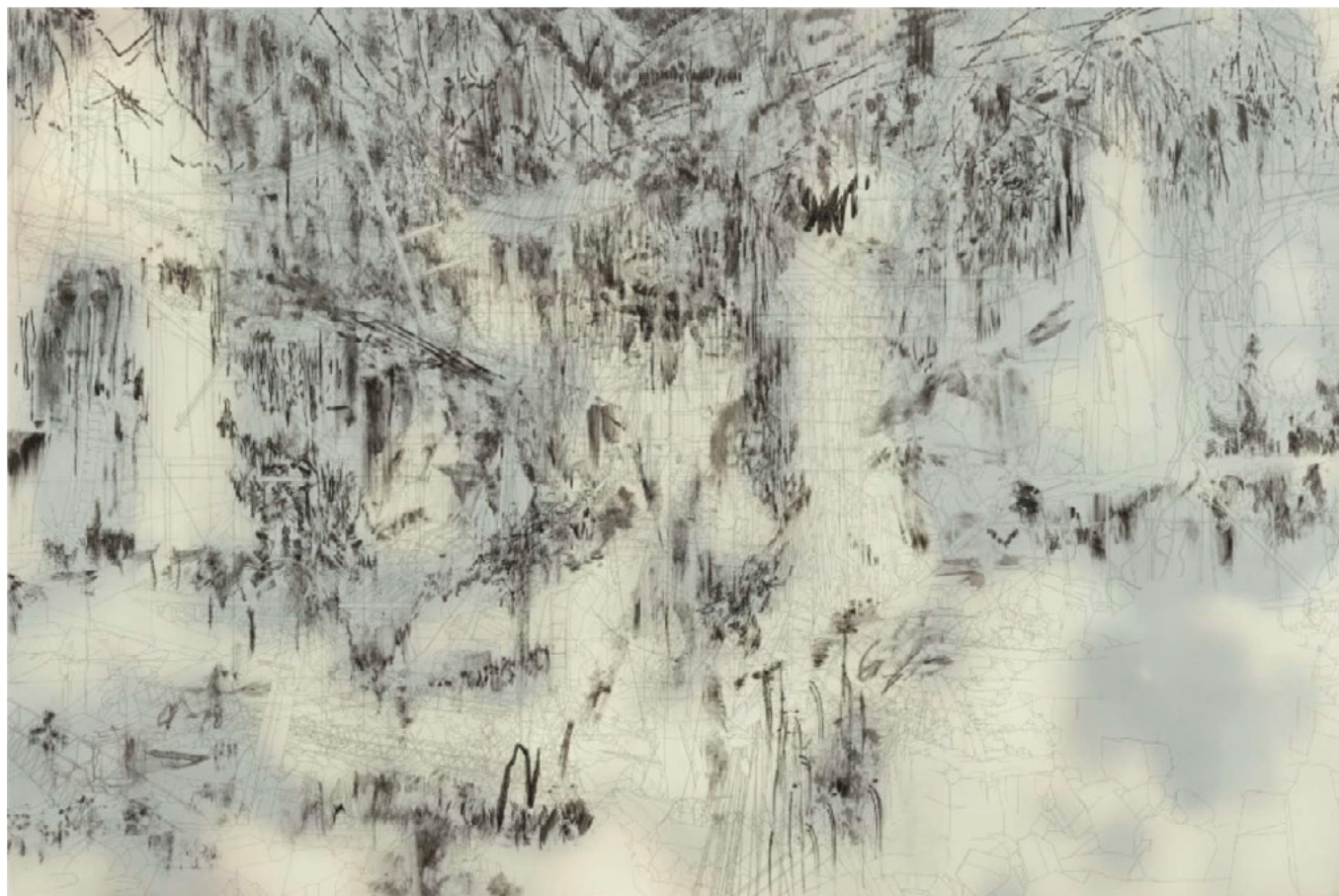
CHIMERA, 2013 Tinta y acrílico sobre lienzo/ Ink and acryliv on canvas 243,8 x 365,8 cm.